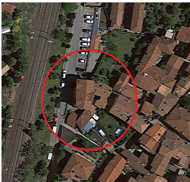
Vista Aerea Via IV Novembre n. 50